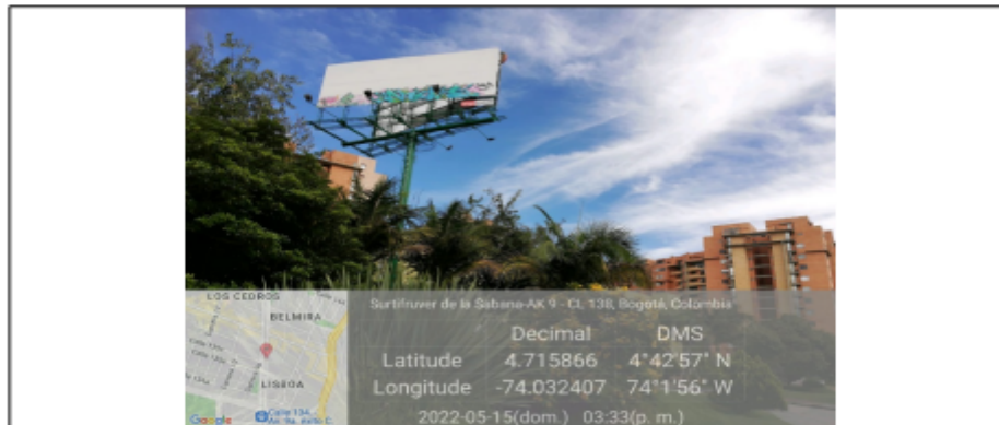
Foto 1. Vista panorámica del predio y de la valla ubicada en la Av. Carrera 9 No. 135 – 50 (dirección catastral) orientación Norte-Sur