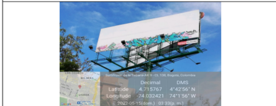
Foto 2. Vista del panel orientación Norte-Sur y de la estructura de la valla, en buenas condiciones y estable.